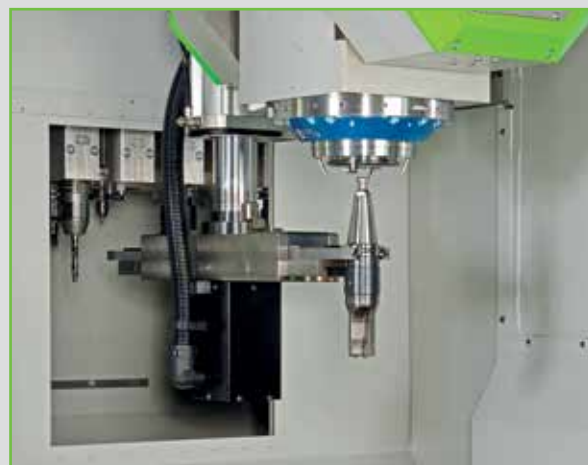
Werkzeugwechsler 30fach mit Doppelgreifer.