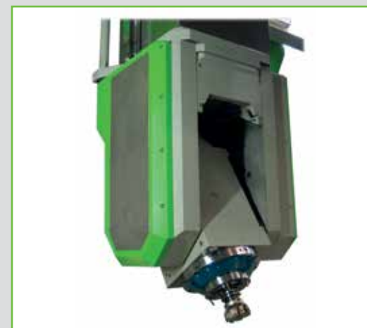
1-Achs Fräskopf 15000 upm Schwenkbereich B-Achse +/- 90°