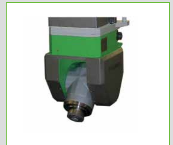
2-Achs Fräskopf 15000 upm Schwenkbereich C-Achse 275° / A-Achse +/- 95°