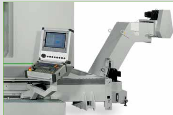
Späneförderer in Maschinentisch integriert Durch die offene Tisch-Bauweise ist eine problemlose Spänenentsorgung gewährleistet.